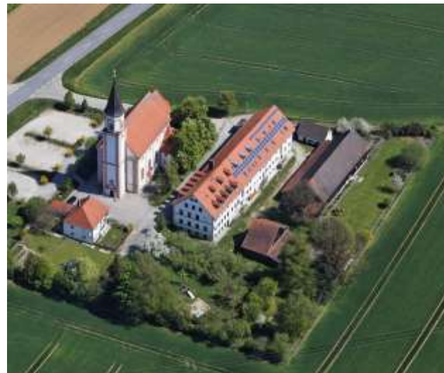
Das Geistliche Zentrum für Familien mit Wallfahrtskirche Heiligenbrunn

Für all diejenigen, denen die Stärkung von Ehe und Familien am Herzen liegt.