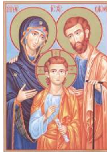
Ikone "Heilige Familie" in der Hauskapelle

und die Anliegen des Geistlichen Zentrums für Familien die nächsten zwei Jahre mittragen.